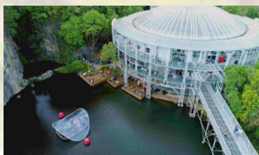
Opera de Alambre – Curitiba – PR