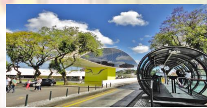
Museo del Ojo