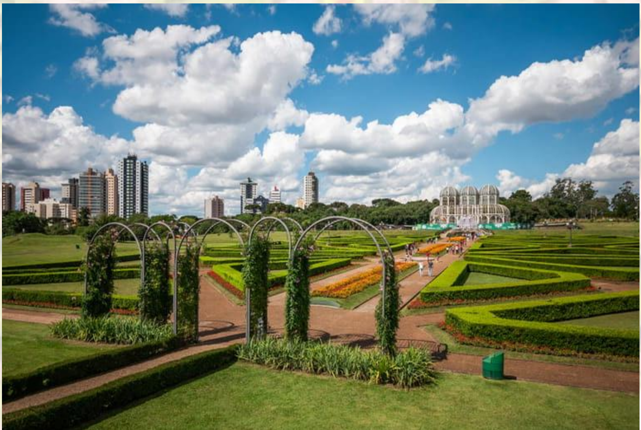
Jardín Botánico – Curitiba – PR