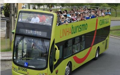
Línea de Turismo –Autobús Panorámico de Curitiba